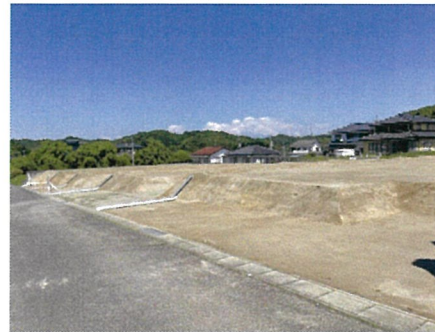
現地土地写真 2022年5月24日撮影